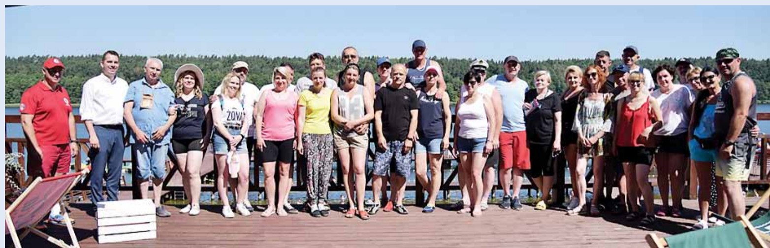
Lidzbarskie Srebrne Gody w kajaku.