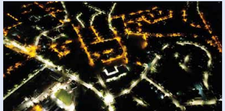
Wymieniliśmy stare oświetlenie na terenie całej gminy na nowe – ledowe i energooszczędne.