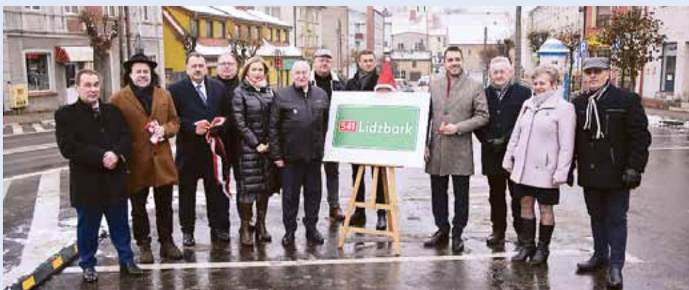
Otwarcie przebudowanej drogi wojewódzkiej nr 541 przy ulicy Nowy Rynek.