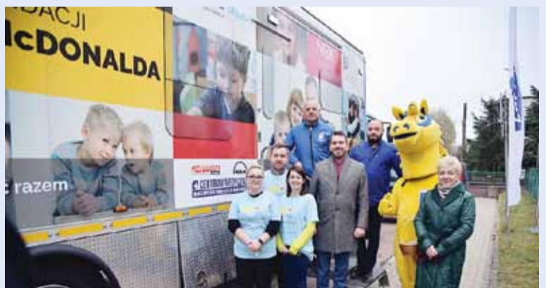
W Lidzbarku ponownie pojawił się autobus Fundacji Ronalda McDonalda który przebadał 60 najmłodszych pacjentów pod kątem nowotworów