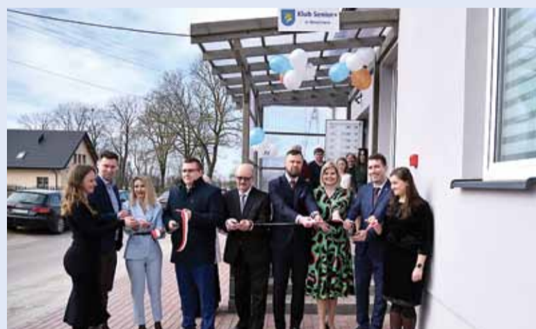
Otworzyliśmy Klub Seniora w Wawrowie. To drugie takie po Lidzbarsku, dedykowane miejsce specjalnie dla Seniorów.