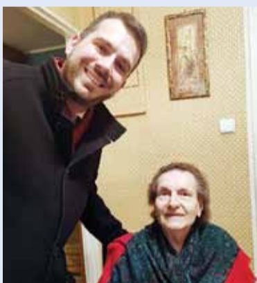
Wydaliśmy 100 paczek świątecznych dla Seniorów z naszej gminy.