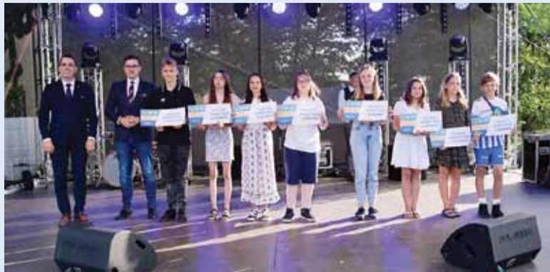
91 uczniów odebrało stypendia za wyniki w nauce oraz bilety na Wyjazd Moich Marzeń.

• W grudniu do Lidzbarka trafiło 318 ton węgla, który mieszkańcy zakupić mogli w ramach zakupu na preferencyjnych zasadach.