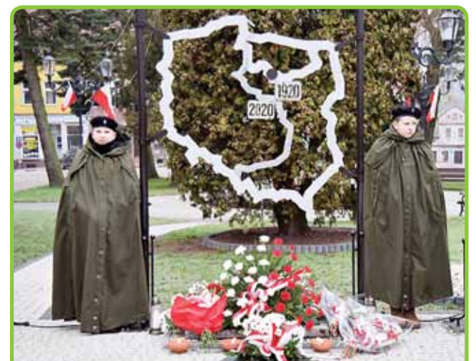
103 LATA WOLNOŚCI