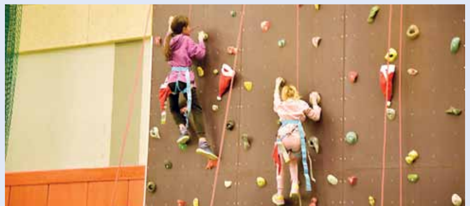
W hali sportowo-widowiskowej stanęła ścianka wspinaczkowa.