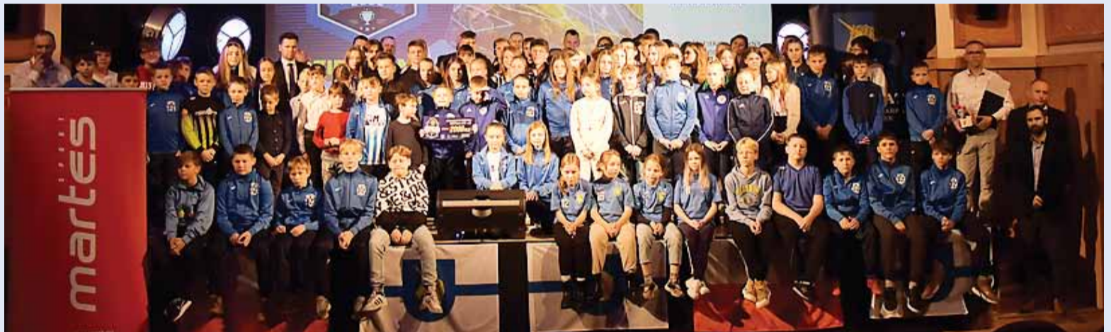
VII Gala Sportu – pula nagród przekazana na sport wyniosła ponad 175 tys zł.