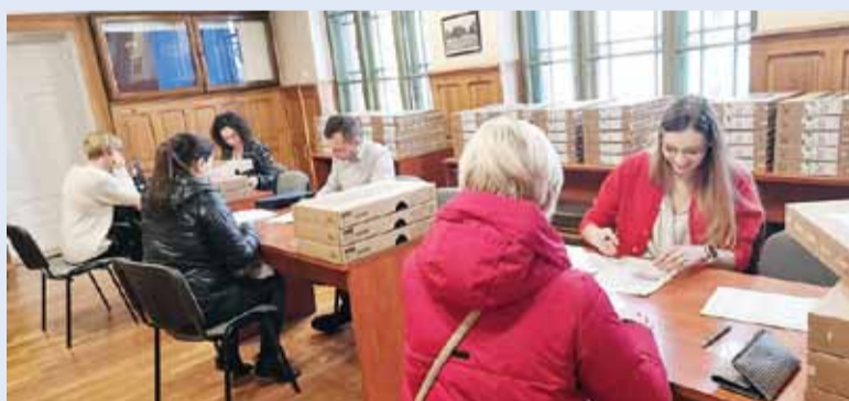
Rządowy program wsparcie dzieci i wnuków byłych pracowników PGR w rozwoju cyfrowym, na który Lidzbark otrzymał prawie 1,3 mln zł zakończony. W ramach projektu „Wsparcie dzieci z rodzin pegeerowskich w rozwoju cyfrowym – Granty PPGR wydaliśmy 500 laptopów.