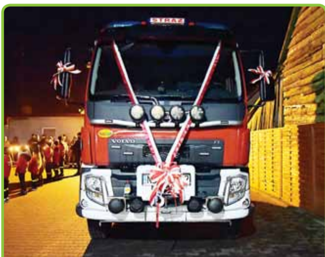
NOWE AUTO DLA OSP KIEŁPINY