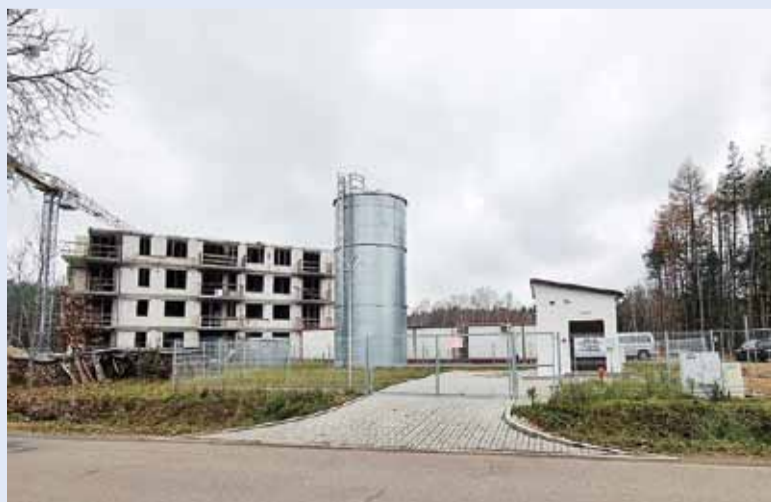
W połowie lipca swoją pracę rozpoczęła lidzbarska stacja podnoszenia ciśnienia wody zlokalizowana przy ul. 3 Maja.