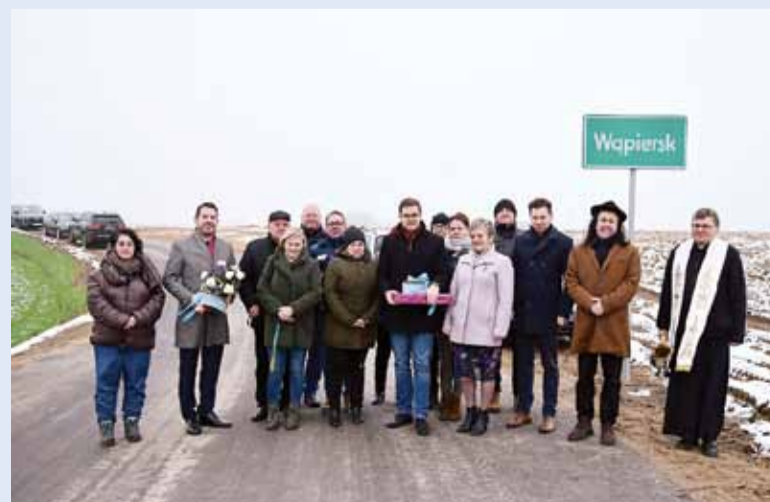
Oficjalnie otworzyliśmy nowo wybudowaną drogę Koty – Wąpiersk, chodnik w Dłutowie, wyremontowaną ul. Żeromskiego.