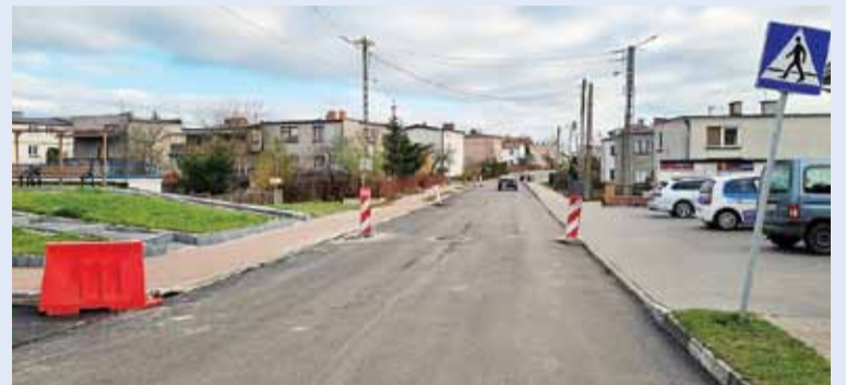
Przebudowaliśmy ulicę Brzozową. Nowy asfalt i kilkadziesiąt metrów nowego chodnika.