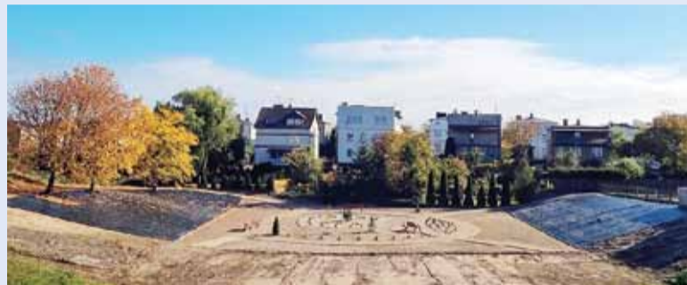
Lidzbarski Budżet Obywatelski - Zagospodarowanie przestrzeni publicznej za Przychodnią Zdrowia, czyli drugi etap projektu, który mieszkańcy wybrali w ubiegłorocznym głosowaniu.