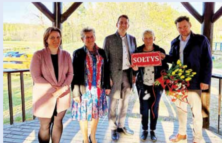
Wybraliśmy nowego sołtysa w Kotach.