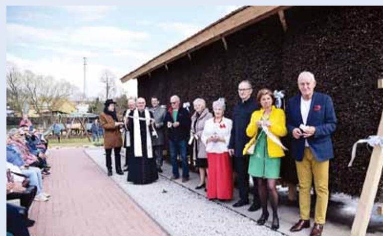
Wspólnie z gwiazdami Sanatorium Miłości otworzyliśmy tężnię solankową na lidzbarskim Bulwarze nad Welem.