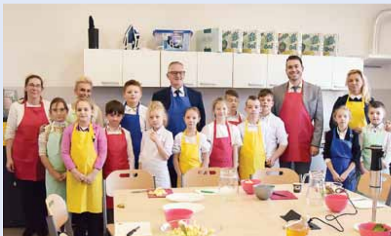
Pozyskaliśmy 325 500,00 zł dla szkół z terenu Gminy Lidzbark w ramach programu „Laboratoria Przyszłości”.

• Lidzbarski Budżet Obywatelski - Zagospodarowanie przestrzeni publicznej za Przychodnią Zdrowia, czyli drugi etap pro-